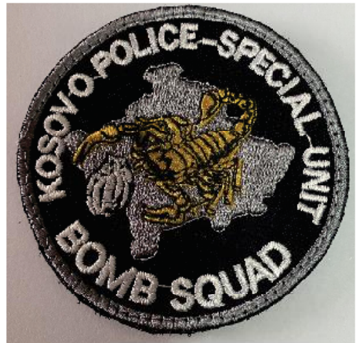
Mostra e ofruar nga OE i rekomanduar

Emblema të jetë e thurur/nderlidhur sipas dizajnit me ngjyrë dhe përshkrimit në foto.