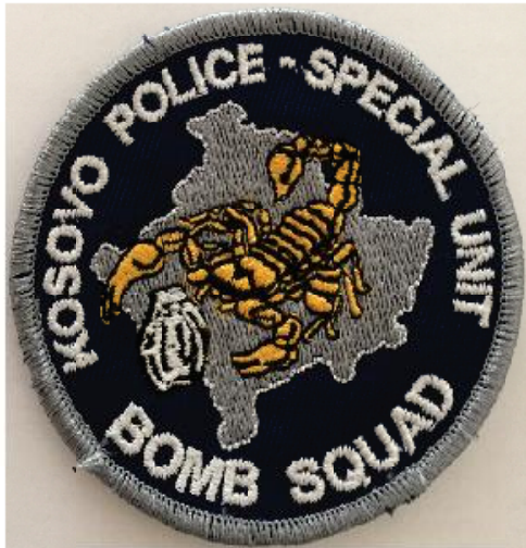
Mostra e kerkuar nga AK