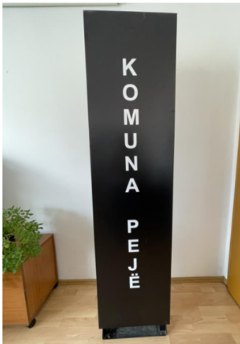
1. Pro print