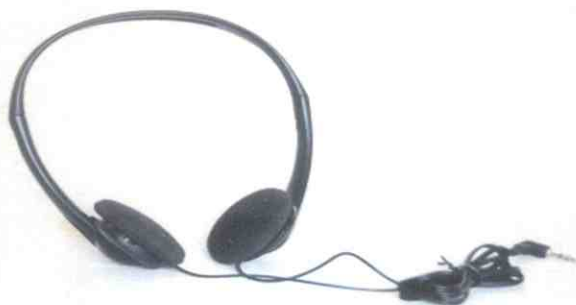
VIS-HPD head phone for delegates