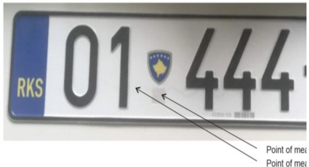
Figure 1: Measuring points for thickness del