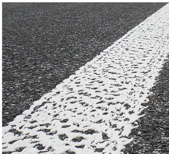
Unregelmäßiges_Agglomerat me plastikë të ftohtë 2K