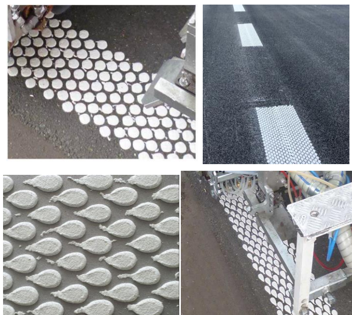
Fig.2.2. Format e shiritave të mesit të rrugës “multi-dot”

Në vendimin OSHP:2024/0452 përcakton shprehimisht se përpos formës “multi-dot”, AK duhet të lejoj edhe forma tjera të vijave me materiale tjera ekuivalente (jo vetëm termoplastike por edhe plastikë të ftohtë). Prandaj në pikën 19.6 të specifikimit teknike në pjesën ku kufizohet forma e pikave vetëm në “multi-dot” dhe materiali vetëm si “termoplastik”, OSHP ka kërkuar nga AK që të ndryshohen/plotësohen ashtu që të lejohen edhe forma (dhe materiale) të tjera të ngjashme, ekuivalente ose më të avancuara. Pra të futet termi “ose e barasvlefshme/ekuivalente” me qëllim që të mos kufizohet konkurrenca e lirë e operatorëve ekonomik. Në këtë rast si forma të ngjashme mund të manifestohen format e rrumbullakëta, katërore, Agglomerat etj. Qëllimi i këtyre pikave është paralajmërimi i vozitësve gjatë ndërrimit të shiritëve në rrugë. Ky efekt arrihet pavarësisht formës dhe mbi të gjitha, ky efekt arrihet edhe me materiale tjera dhe jo vetëm me material termoplastik.