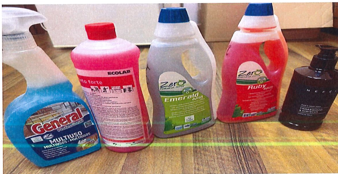
Foto mostrat e kompanisw sonw

Me qenë së oferta jonë është me çmim me të lartë, çmim të cilin e ka përcaktuar kërkesa për produkte ekologjike dhe të drejtat sociale të të punësuarve e cilat kanë përcaktuar vlerën e oferta jonë financiare do të mbulonte të gjitha kërkesat e dosjes së tenderit. Bashjohitur me ankesën të prezantuar faktet të cilat dëshmojnë se mostrat e produkteve tona janë ekologjike dhe të dëshmuara me informacion MSDS.