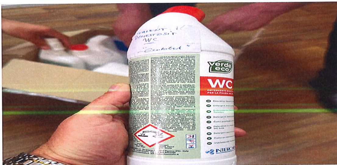
Foto tw prokuteve të operatorit ekonomik të rekomanduar pwr kontratw:

Gjatw qasjws nw dokumentet dhe mostrat e operatorit ekonomik tw rekomanduar, mostrat nuk ishin ekologjike, pas qasjes në dokumentacionin e operatorit ekonomik të rekomanduar për kontratë, kemi konstatuar se edhe mostrat e dorëzuara nga ky operator nuk kanë mundur të jenë produkte ekologjike për të gjitha pozicionet e kërkuara. Konkretisht, për produktin nr. 3 "Dezinfektues, detergjent për pastrimin e nyjave sanitare (pllakave, guacave dhe lavamanëve) – Domestos ose ekuivalent", vetë natyra dhe përbërja e produktit si dezinfektues nënkupton praninë e substancave aktive kimike të klasifikuara si të rrezikshme, gjë që dëshmohet edhe përmes fletë-datave të sigurisë (SDS/MSDS). Për rrjedhojë, nëse Autoriteti Kontraktues ka vlerësuar se produktet tona nuk i plotësojnë kriteret ekologjike, i njëjti standard është dashur të zbatohet në mënyrë të barabartë edhe ndaj operatorit ekonomik të rekomanduar për kontratë. Në të kundërtën, kemi të bëjmë me trajtim të pabarabartë të operatorëve ekonomikë dhe me një vlerësim joobjektiv të mostrave, në kundërshtim me parimet themelore të barazisë, proporcionalitetit dhe transparencës në prokurimin publik.