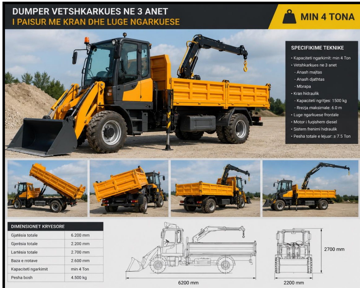
Foto – Ilustrim teknik i pajisjes së kërkuar nga AK

Nga fotografia dhe specifikat teknike shihet se nuk kemi të bëjmë me pajisje të zakonshme ndërtimore, por me makineri të veçantë dhe të kombinuara. Kërkimi i një pajisjeje të tillë, pa lejuar pajisje ekuivalente, kufizon konkurrencën dhe mund të favorizojë operatorë të caktuar.